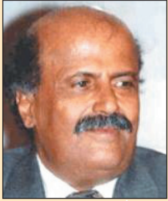
اللواء أحمد مساعد حسين

الأخ احمد الحبشي رئيس مجلس إدارة مؤسسة 14 أكتوبر للصحافة والطباعة والنشر رئيس تحرير صحيفة 14 أكتوبر بمناسبة الذكرى الخامسة والأربعين لتأسيس صحيفة 14 أكتوبر الرائدة أتقدم إليكم بالتحيات الحارة والتهاني الصادقة لكم وللأخوة والأخوات العاملين إلى جانبكم كافة في هذه المؤسسة العزيزة على قلوبنا جميعاً : لأنها تحمل اسم ثورة 14 أكتوبر الشعبية التحررية التي دكت معائل الاستعمار وحررت الجنوب واعدت إليه سيادته على أراضيه وجعلت منه دولة نظام وقانون مهابة على مستوى المنطقة والعالم، إنني سعيد جداً لما لسه من تطور كبير في مستوى الصحيفة شكلاً ومضموناً، وخاصة بعد نجاحكم في تنفيذ مشروع المطبعة الصحفية الملونة وتحديث مختلف مرافق المؤسسة.. وكنت أتمنى أن احتفل معكم داخل هذه المؤسسة العزيزة على قلبي شخصياً . لأشارك جميع الصحفيين والعمال فرحتهم بهذه المناسبة الجديدة وفقكم الله .. وإلى الأمام.